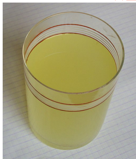
Petit lait