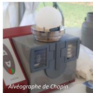
Alvéographe de Chopin