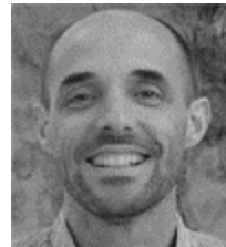
Partenariats nationaux 09 72 58 53 56 Contacter par mail