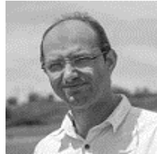
Grandes cultures et Fertilisation