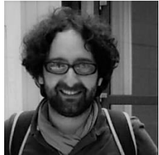
Coordinateur Pôle Végétal