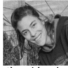
Systèmes Légumiers et maraîchers