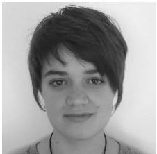
Biocides, PNPP Hortense LEJEUNE Contacter par mail