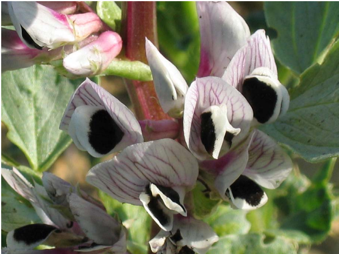
CREAB MP : Gros plan de fleurs de féverole.

Action réalisée avec le concours financier :