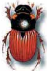
Aphodius fimetarius. 5 à 8 mm. Très commun. Dans les bouses, les croffins et le fumier.