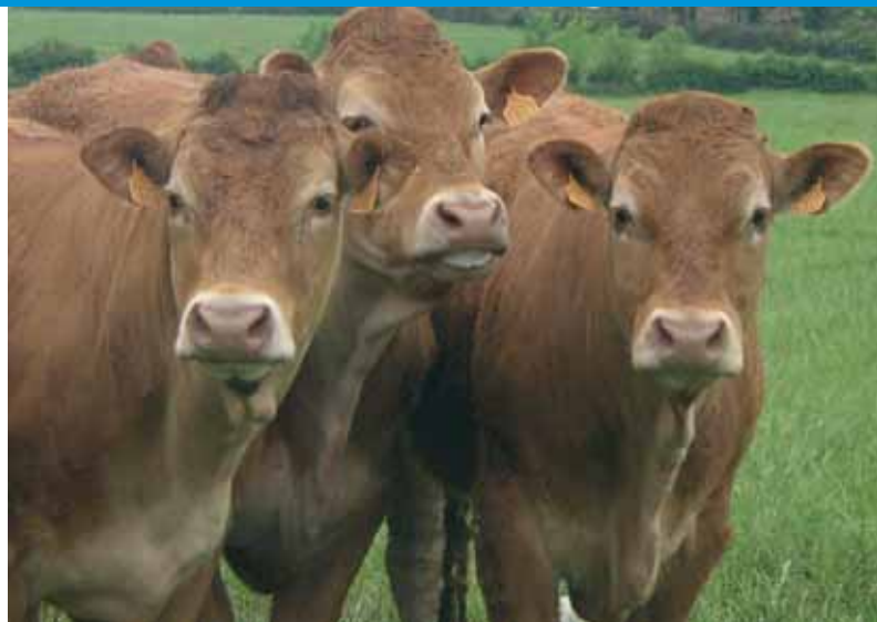
La présence de bousiers est favorable au troupeau.

Les bousiers peuvent être intoxiqués par des molécules utilisées comme antiparasitaire dans les troupeaux d'herbivore, suivant le type, la dose et la voie d'administration (ivermectine, pyréthrinoides...)