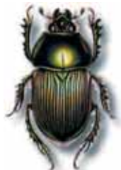
Geotrupes mutator - 14 à 26 mm. Visible d'avril à octobre dans les croffins et les bouses fraîches.

Les bousiers peuvent être intoxiqués par des molécules utilisées comme antiparasitaire dans les troupeaux d'herbivore, suivant le type, la dose et la voie d'administration (ivermectine, pyréthrinoides...)