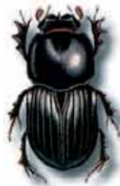
Aphodius fossor. 8 à 11 mm. très commun. D'avril à octobre sur bouses fraîches

Massifs et puissants, les géotrupes sont des fouisseurs sombres aux reflets métalliques bleus, verts ou violets. Leurs pattes avant sont fortes et dentées, ce qui facilite l'activité fouisseuse. Pour abriter réserves et œufs, le couple construit un terrier sous la bouse. Il est formé d'un puits d'où partent des galeries horizontales en cul-de-sac destinées à recevoir chacune un œuf. La femelle referme ensuite la galerie en la remplissant de terre.