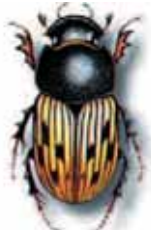
Aphodius luridus. 6 à 9 mm. de juin à juillet, dans les bouses et croffins de chevaux et moutons.