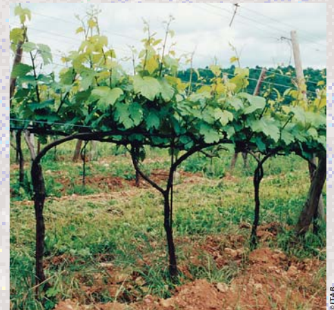
Jeune vigne enherbée

Les racines sont les organes nutritionnels principaux des plantes. En puisant dans le sol l'eau et les sels minéraux, acheminés par les vaisseaux du xylème (sève brute), elles approvisionnent les feuilles en éléments de base, qui lors du processus de photosynthèse permettent la fabrication de sucres et de molécules plus complexes (protéines). La bonne santé et le développement des racines conditionnent ceux de la plante toute entière. Plus la zone de prospection est importante (en surface et en profondeur), plus les racines ont la capacité à fournir dans la durée les éléments utiles à la plante. La