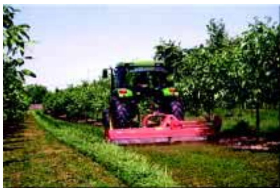
Broyage de l'enherbement

Les apports sont à moduler chaque année en fonction de la production de noix (augmentation des exportations) et du résultat de l'observation de l'état végétatif de l'arbre. L'enherbement du verger influe sur les flux en produisant de la matière organique et en consommant une partie des éléments.