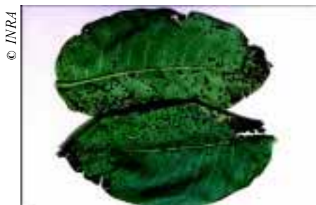
Bactériose sur feuilles

Les produits cupriques à base de sulfate de cuivre, et d'hydroxyde de cuivre sont efficaces en lutte préventive. Certaines souches sont résistantes au cuivre. Les pulvérisations se font en priorité au printemps à raison de 2 ou 3 applications (du stade Df2 à Gf).