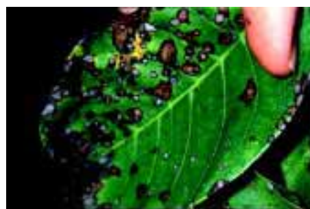
Anthracnose sur feuille

Cette maladie se développe plus rapidement lors de printemps humides. Le champignon hiverne dans les feuilles. Il provoque au printemps des nécroses polygonales sur feuilles plus grandes que pour la bactériose, entraînant leur chute. Les dégâts sur fruits ne touchent que les brouss mais peuvent altérer le calibre et la maturité. La protection du verger est assurée par la lutte contre la bactériose.