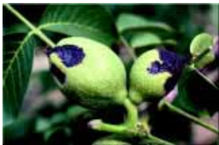
Bactériose du noyer. Tâches sur fruits

La bactérie hiverne dans et à la surface des bourgeons et dans les chatons et se multiplie au printemps en présence d'une humidité élevée et accompagnée de températures comprises entre 16 et 29°. Elle provoque des taches (feuilles et fruits) et la chute des fruits. Les variétés à débournement précoce et à fructification latérale sont plus sensibles.