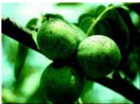
Dégâts de carpocapse sur noix

Il s'agit du lépidoptère ( Cydia pomonella ) présent également en verger de pommiers et poiriers. La lutte au moyen du virus de la granulose ou de la confusion sexuelle est possible et efficace en présence de populations faibles à moyennes. Les conditions d'utilisation de ces techniques sont, sur plusieurs points, similaires à celles préconisées pour lutter contre ce ravageur sur les pommes et les poires. En général, 3 à 5 traitements suffisent pour maîtriser le carpocapse. La méthode de lutte par confusion sexuelle nécessite un temps de pose des diffuseurs important (7 à 10 h/ha). Le diffuseur devant être placé dans le tiers supérieur de l'arbre, un outillage spécifique est souvent nécessaire dans les vergers adultes. Actuellement, il n'existe pas de diffuseurs homologués sur la culture.